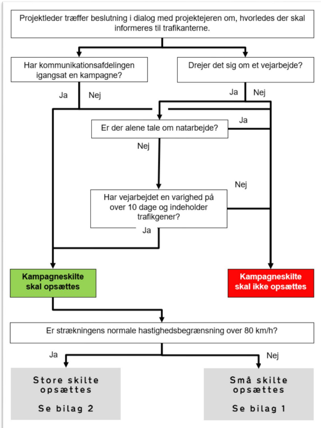
Beslutningsproces til store og små kampagneskilte.