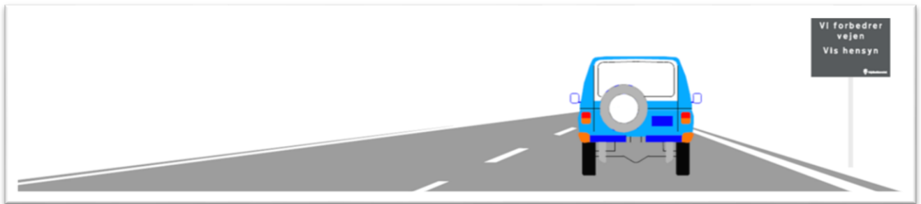
Eksempel på små kampagneskilte ved vejarbejder