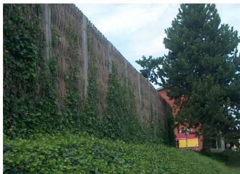
Støjskærm med barket pilefacade og beplantning