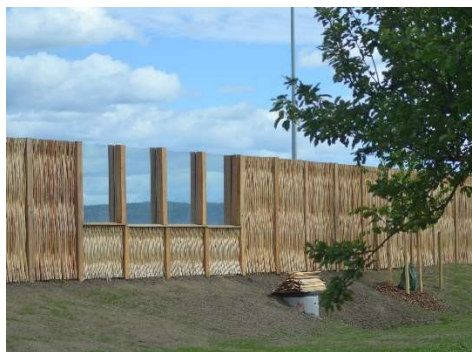
Støjskærm med afbarket pilefacade og transparent felt