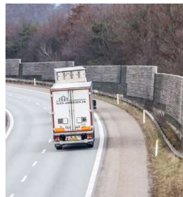
Støjskærm i træ