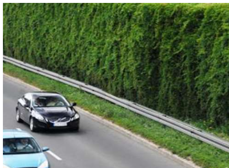
Støjskærm til beplantning (med beplantning etableret)