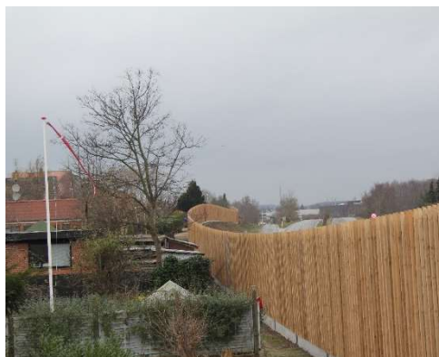
Støjskærm set fra beboernes side