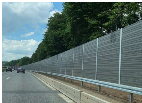
Støjskærm med kassetter i aluminium