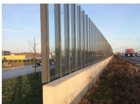
Støjskærm med aluminiumssøjler og akrylplader