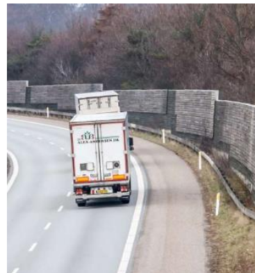
Støjskærm i træ