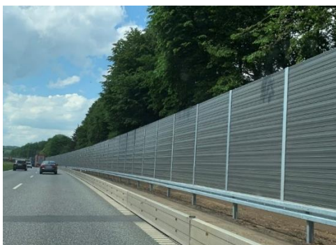
Støjskærm med kassetter i aluminium