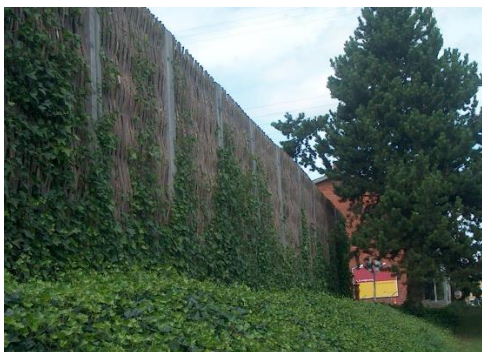
Støjskærm med barket pilefacade og beplantning