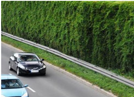
Støjskærm til beplantning (med beplantning etableret)