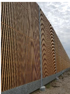
Støjskærm med træbeklædning