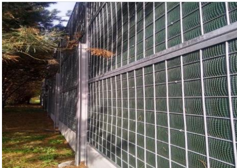
Støjskærm til beplantning (før beplantning er etableret)