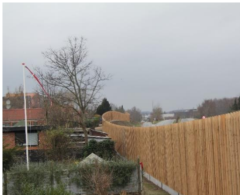
Støjskærm set fra beboernes side