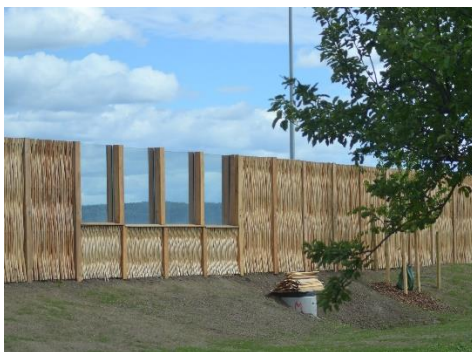
Støjskærm med afbarket pilefacade og transparent felt