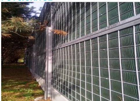
Støjskærm til beplantning (før beplantning er etableret)